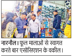
नारनौल। फूल मालाओं से स्वागत करते बार एसोसिएशन के वकील।