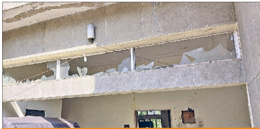
कम्युनिटी सेंटर के टूटे हुए शीशे

सेंटरों में शौचालय, कमरे और बैठक हाल सहित अन्य सुविधाओं का हुआ नवीनीकरण