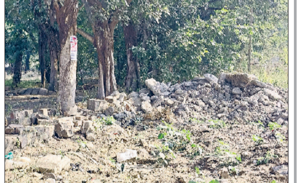
रेवाड़ी। कम्युनिटी सेंटर की टूटी पड़ी चारदिवारी।

सेक्टर-4 में करोड़ों रुपये की लागत से बना कम्युनिटी सेंटर बिल्कुल जर्जर हो चुका है। सेंटर के पास रहने वाले लोग इसे पशुओं के आश्रय के रूप में काम ले रहे हैं। साथ ही गोबर के उपले भी कम्युनिटी सेंटर में ही बनाए जा रहे हैं। कम्युनिटी सेंटर की चारदिवारी तक पूरी तरह टूट चुकी है। अधिकारियों की बेरुखी के चलते यह दुर्दशा का शिकार होना चला गया। सेंटर का भवन पूरी तरह क्षतिग्रस्त हो चुका है। खिड़की और दरवाजे टूटकर गिर चुके हैं। छत से प्लास्टर गिर रहा है। यहां तक की सेंटर की चारदिवारी की जालियां तक गायब हो चुकी हैं। सेक्टरवासियों को सामूहिक कार्यक्रमों के आयोजन के लिए महंगे चार्ज पर प्राइवेट समारोह स्थल बुक करने पड़ रहे हैं।