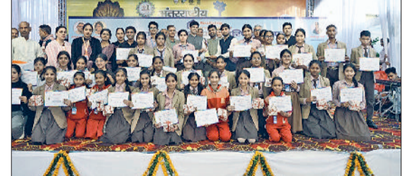
रोवाड़ी। बाल महोत्सव के विजेताओं को सम्मानित करते डीसी।

जिलेभर में विभिन्न स्थानों पर नाकेबंदी की और वाहनों की जांच की। इस सघन जांच में ड्रंक एंड ड्राइव, ओवरस्पीड, रॉना साइड ड्राइविंग, लेन ड्राइविंग के 887 वाहन चालकों के चालान काटे गए। उन्होंने कहा कि शराब पीकर गाड़ी चलाना, तेज गति में गाड़ी चलाना, रॉना साइड में गाड़ी चलाना, सड़क दुर्घटनाओं के बड़े कारण हैं। पुलिस का उद्देश्य सड़कों पर कानून व्यवस्था बनाए रखना और सड़क हादसों को कम करके आम जनता को जान माल की सुरक्षा सुनिश्चित करना है। यातायात नियमों का उल्लंघन करने वालों के खिलाफ पुलिस की सख्ती जारी रहेगी।