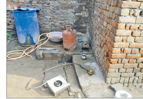
रेवाड़ी। गैस सिलेंडर में आग के बाद रसोई घर का नजारा।

हरजोपुर गांव में मंगलवार सुबह एक घर की किचन में रखे गैस सिलेंडर में आग लग गई। इससे परिजनों व आसपास के लोगों में हड़कंप मच गया। सिलेंडर को घर से बाहर निकालकर किसी तरह आग पर काबू पाया गया। पास में ही हनुमानजी का रोट होने के कारण भीड़ जुटी हुई थी, जिस कारण बड़ा हादसा होने से टल गया। फायर ब्रिगेड की गाड़ी भी