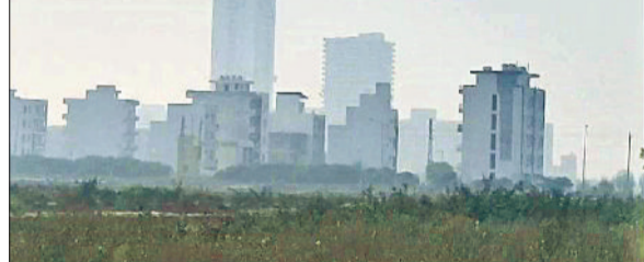
रेवाड़ी। सुबह के समय आसमान में बनी प्रदूषण की चादर।