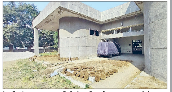
रेवाड़ी। सेक्टर-4 का कम्युनिटी सेंटर, जिसकी मरम्मत का कार्य होगा।

हाल ही में चार कम्युनिटी सेंटरों का मरम्मत कार्य भी संपन्न हो चुका है। इनमें सेक्टर-3 के सेंटर पर 21 लाख 59 हजार रुपये खर्च किए गए। इसके अलावा इंदिरा गांधी कॉलोनी में स्थित सेंटर में 12 लाख 50 हजार रुपये का कार्य किया गया। गुजरवाड़ा के कम्युनिटी सेंटर में 7.50 लाख और वाई नंबर 24 के सेंटर पर 15 लाख रुपये खर्च किए गए। इन कम्युनिटी सेंटरों में शौचालय, कमरे और बैठक हॉल सहित अन्य सुविधाओं का नवीनीकरण किया गया।