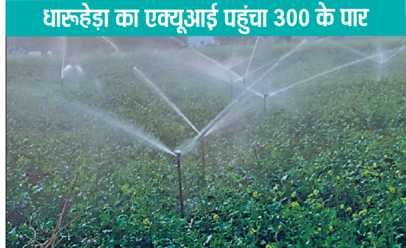
रेवाड़ी। सरसों की फसल में फव्वारों से होती सिंचाई।

तापमान में उतार-चढ़ाव बना रहने से मौसम का मिजाज भी बार-बार बदल रहा है। दिन और रात के तापमान में वृद्धि होते ही सर्दी का असर कम हो गया है। तापमान में जल्द गिरावट आने की संभावना है। प्रदूषण का स्तर एक बार फिर बढ़ने लगा है। 6 दिसंबर से आसमान में बादल छाने और बूदाबांती होने की संभावना जताई जा रही है। मंगलवार को सुबह के समय प्रदूषण के चलते आसमान में धुंध की चादर बनी रही। सुबह से तेज धूप निकलने के बाद ठंड का असर कम हो गया।