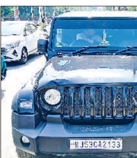
नारनौल। गाड़ी से ब्लैक फिल्म हटाती ट्रैफिक पुलिस।